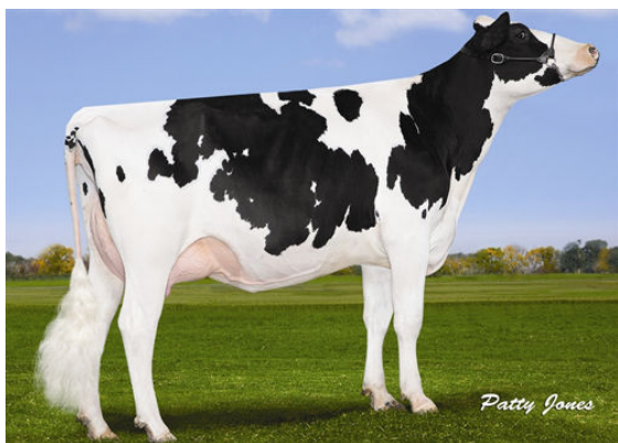
OCCONNORS LAST HOPE GRANDDAM