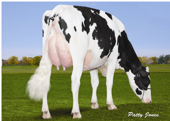
OCCONNORS LAST HOPE GRANDDAM