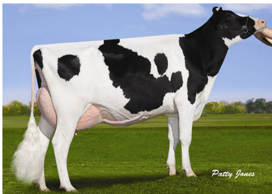
OCCONNORS PLANET LUCIA THIRD DAM